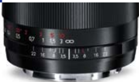
Abbildung zeigt ZE-Anschluss