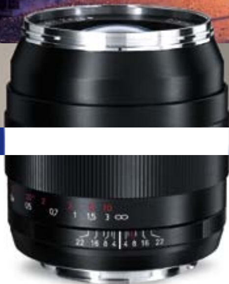
Abbildung zeigt ZE-Anschluss